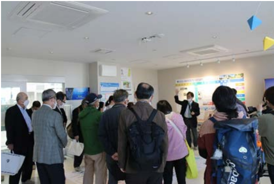
産学交流プラザの施設見学

また、式の前には、学食においてカレーライスを提供、産学交流プラザの施設見学等のイベントも開催し、多くの同窓生が参加しました。