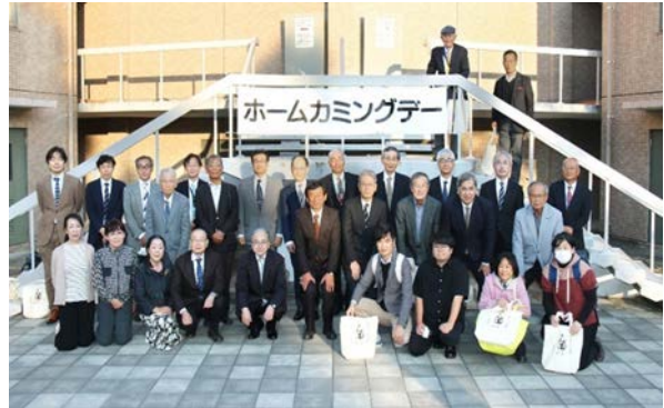
参加者の集合写真